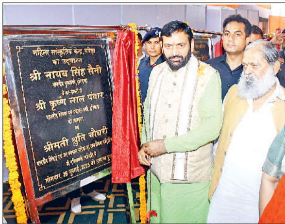
विकास योजनाओं का उद्घाटन व शिलान्यास करते सीएम नायब सैनी व अन्य।

मुख्यमंत्री नायब सिंह सैनी ने जलापूर्ति योजनाओं को सुदृढ़ करने के लिए सोमवार को अंबाला शहर में जल वितरण योजना के विस्तारीकरण के लिए 145 करोड़ रुपये की घोषणा की। साथ ही सेक्टर 24 में 9 एमएलडी क्षमता का वाटर ट्रीटमेंट प्लांट स्थापित करने के लिए 40 करोड़ रुपये तथा एसवाईएल के दोनों ओर क्षतिग्रस्त पैच की मरम्मत के लिए 60 करोड़ रुपये की घोषणा की। मुख्यमंत्री ने ये घोषणाएं सोमवार को अंबाला शहर में तीज उत्सव पर आयोजित राज्य स्तरीय समारोह को संबोधित करते हुए की। इससे पहले मुख्यमंत्री ने अंबालावासियों को विकास परियोजनाओं की सौगात देते हुए 73 करोड़ रुपए की लागत की 9 परियोजनाओं का उद्घाटन व शिलान्यास किया। इनमें 26 करोड़ 49 लाख रुपए लागत की 4 परियोजनाओं का उद्घाटन और 46 करोड़ 34 लाख रुपए लागत की 5 परियोजनाओं का शिलान्यास शामिल हैं। मुख्यमंत्री ने सेक्टर 10 में स्पोर्ट्स स्टेडियम में सिंथेटिक ट्रैक बनाने की घोषणा की। साथ ही नगल पीएचसी में 4 करोड़ रुपये की लागत से एक अतिरिक्त ब्लॉक बनाने तथा भूमि उपलब्धता के आधार पर शहर की मोटर मार्केट को स्थानांतरित करने की भी घोषणा की। मुख्यमंत्री ने घोषणा करते हुए कहा कि सेक्टर 23 में नया फायर स्टेशन