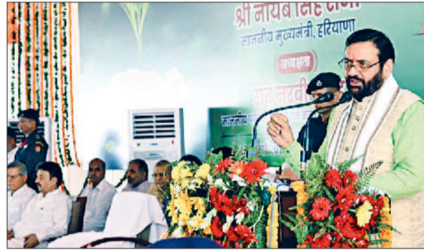
यमुनानगर। कलेसर में आयोजित राज्यस्तरीय समारोह में संबोधित करते हुए मुख्यमंत्री नायब सिंह सैनी व समारोह में भाग लेते लोग।