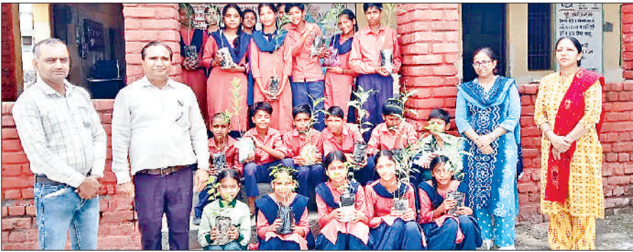
पौधों के साथ पर्यावरण को संरक्षित करने का संकल्प लेते छात्र।

राजकीय उच्च विद्यालय चुडियाला के प्रांगण में सोमवार को वन महोत्सव का आयोजन किया गया। इस दौरान सभी छात्रों ने एक पेड़ मां के नाम अभियान के तहत पहले तो स्कूल प्रांगण में पौधारोपण किया। इसके अलावा उन्हें घर पर एक-एक पौधा रोपण के लिए वितरित किया गया। सभी छात्रों ने स्कूल प्रांगण को भी हरा बना रखने का संकल्प लिया। मुख्याध्यापक अनिल