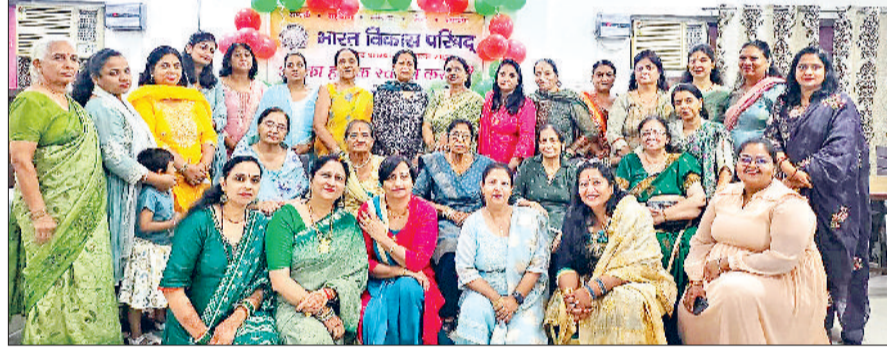
अंबाला। तीज पर्व में हिस्सेदारी करने वाली महिलाएं।