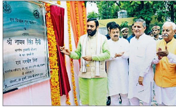
यमुनानगर। कलेसर में वन महोत्सव कार्यक्रम के दौरान वन विभाग के नवनिर्मित विश्रामगृह का उद्घाटन करते हुए मुख्यमंत्री नायब सिंह सैनी।