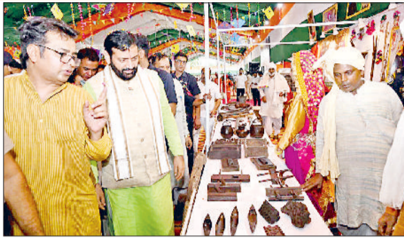
तीज उत्सव पर लगाई प्रदर्शनी का अवलोकन करते सीएम नायब सैनी।

बनाया जाएगा। साथ ही शहर में डॉक्टरों के निहायशी मकानों के लिए 20 करोड़ रुपये देने की घोषणा की। इसके अलावा, भूमि उपलब्धता के आधार पर लावकोट परिसर में कर्मचारियों के लिए केंद्रीयकृत कार्यालय अवासीय सुविधाओं युक्त बनाया जाएगा। मुख्यमंत्री ने नया जलभराव की समस्या से स्टीम वॉटर डिस्पोजल के निर्माण के लिए 1.50 करोड़ रुपये की घोषणा की। सीएम सैनी ने पुराना दिल्ली रोड नाले को बरसाती पानी की निकासी के लिए पक्का करवाने के लिए 12 करोड़ रुपये की घोषणा की। उन्होंने अंबाला