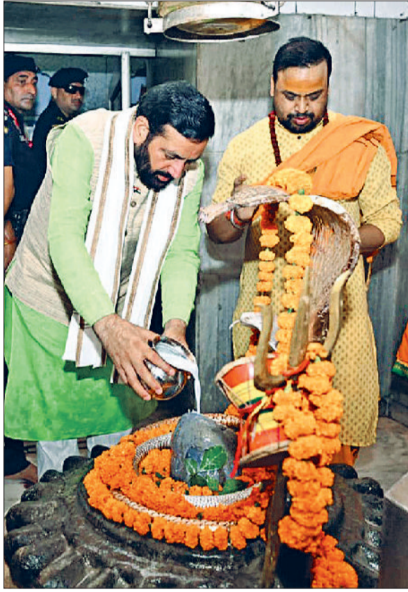
यमुनानगर। कलेसर में आयोजित राज्यस्तरीय वन महोत्सव के दौरान कलेसर मठ में महादेव की पूजा अर्चना करते हुए मुख्यमंत्री नायब सिंह सैनी।

मुख्यमंत्री नायब सिंह सैनी ने राज्यस्तरीय वन महोत्सव में शिरकत करने से पहले कालेश्वर महादेव मठ मंदिर में जाकर भगवान शिव की पूजा अर्चना की और प्रदेश की सुख समृद्धि के लिए कामना की। उन्होंने कहा कि वन महोत्सव प्रकृति के प्रति हमारी कृतज्ञता, हमारे दायित्व और आने वाली पीढ़ियों का स्वस्थ भविष्य सुनिश्चित करने के हमारे संकल्प का प्रतीक है। मुख्यमंत्री ने कहा कि कलेसर क्षेत्र न केवल पर्यावरण की दृष्टि से महत्वपूर्ण है। बल्कि पर्यटकों, प्रकृति प्रेमियों और ट्रेकिंग करने वालों के लिए भी बेहद आकर्षक स्थल है। सरकार कालका से लेकर कलेसर तक के पूरे क्षेत्र को पर्यटन हब के रूप में विकसित कर रही है।