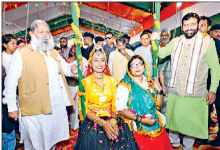
महिलाओं को झूला झूलाने सीएम नायब सैनी व परिवहन मंत्री अनिल विज।

समारोह में महिला एवं बाल विकास मंत्री श्रुति चौधरी ने कहा कि तीज का उत्सव महिला सशक्तिकरण के लिए संकल्प लेने का अवसर है। आज हम यह प्रण लेते हैं कि हर बेटी को सम्मान, हर माँ को सुरक्षा और हर बच्चे को अवसर देना हमारी प्राथमिकता रहेगी। उन्होंने गर्व के साथ बताया कि 'बेटी बचाओ, बेटी पढ़ाओ' अभियान की शुरुआत स्वयं प्रधानमंत्री नरेंद्र मोदी ने हरियाणा की धरती से की थी। जब 2015 में यह योजना शुरू हुई, उस समय हरियाणा में लिंगानुपात की स्थिति चिंताजनक थी। लेकिन निरंतर प्रयासों और योजनाओं के प्रभाव से अब इस असंतुलन में काफी सुधार आया है। उन्होंने ने कहा कि सरकार द्वारा महिलाओं और बच्चों के लिए कई कल्याणकारी योजनाएं चलाई जा रही हैं। मुख्यमंत्री दुध उपहार योजना, प्रोटीन बार योजना, आंगनबाड़ी केंद्रों को स्मार्ट क्लासरूम में बदलने की योजना, पोषण कार्यक्रम इत्यादि के माध्यम से महिलाओं और बच्चों के कल्याण के लिए काम किया जा रहा है। उन्होंने उपस्थित