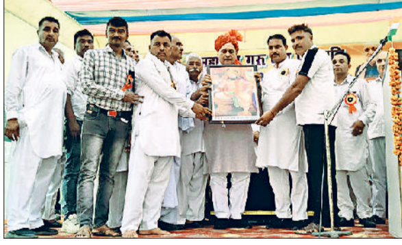
यमुनानगर। कपालमोचन स्थित प्रजापति धर्मशाला में आयोजित समारोह में मुख्यातिथि कैबिनेट मंत्री रणवीर सिंह गंगवा को स्मृति चिन्ह देकर सम्मानित करते प्रजापति समाज के लोग।

रचना की थी। इसके बाद उनके पुत्र दक्ष प्रजापति ने इन तत्वों का उपयोग बर्तनों की कलाकारों में किया और इस प्रकार वे मनुष्यों में पहले कलाकार के रूप में माने जाते हैं। गंगवा ने बताया कि कुम्हार को प्रजापति की संतान माना जाता है और उन्हें ही प्रजापति के रूप में सम्मानित किया जाता है। कैबिनेट मंत्री रणवीर गंगवा ने कहा कि चाक